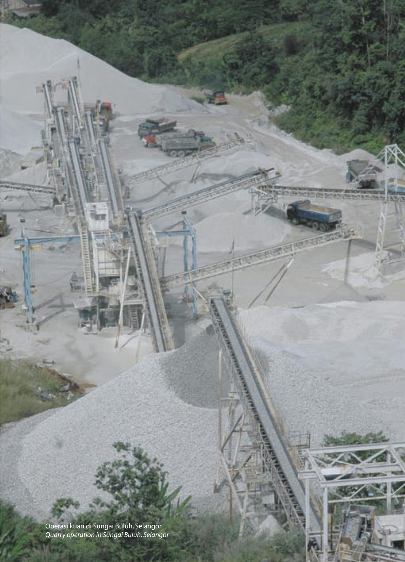
Operasi kuari di Sungai Buluh, Selangor Quarry operation in Sungai Buluh, Selangor