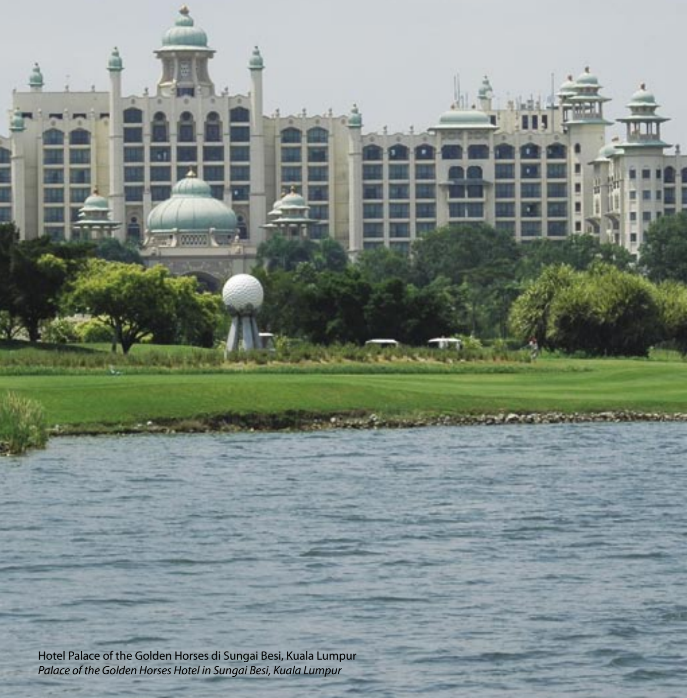
Hotel Palace of the Golden Horses di Sungai Besi, Kuala Lumpur Palace of the Golden Horses Hotel in Sungai Besi, Kuala Lumpur